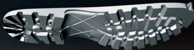
Battistrada in gomma Vibram® Rubber Vibram® outsole